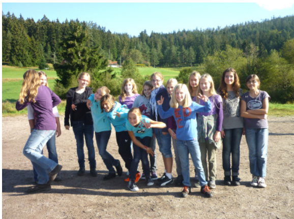
Halte sich, wer kann: die Kl. 6b in Herrenwies

„global player“. Schon im letzten Schuljahr wurden die Kontakte angebahnt, die Industrie- und Handelskammer Karlsruhe half ebenfalls, man lernte sich kennen und tauschte erste Ideen aus. In diesem Schuljahr finden bereits zwei nachhaltige Projekte mit Daimler statt. Und so ist es höchste Zeit, dass in einer Feierstunde am 15.11. der Kooperationsvertrag in Anwesenheit einer Reihe hochrangiger Vertreter und nicht zuletzt der Presse und des Fernsehens unterzeichnet werden soll.