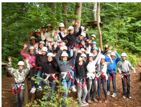
Bärenhöhle, Steinzeitmenschen, Abenteuer: die Kl.6d in Erpfingen

Eine weitere Premiere steht ins Haus: Die erste Matinée musicale. Wenn auch Ihnen und euch, liebe Schüler/innen, der Sonntag Vormittag geeignet erscheint, klassische Musik und Jazz zu hören, neue Arbeiten aus der Bildenden Kunst zu sehen, dabei ein Glas zu trinken und einen Happen zu essen, mit Eltern und Lehrern ins Gespräch zu kommen - dann sind Sie / seid ihr am 20.11. um 10 Uhr bei uns genau richtig. Wir benötigen noch ein bisschen Unterstützung fürs Buffet (Speisen)- an den Elternabenden komme ich diesbezüglich auf Sie zu.