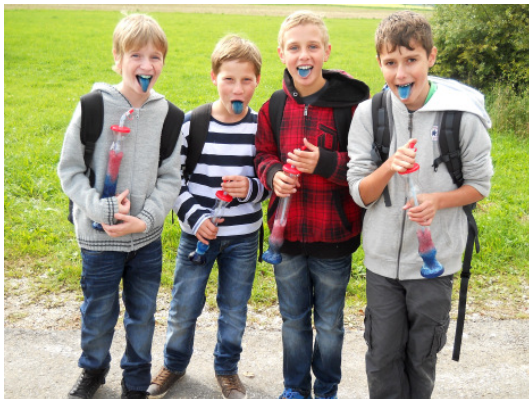
So schön kann der Schulbeginn sein... (Kl. 6d)

Liebe Schülerinnen und Schüler, liebe Eltern!