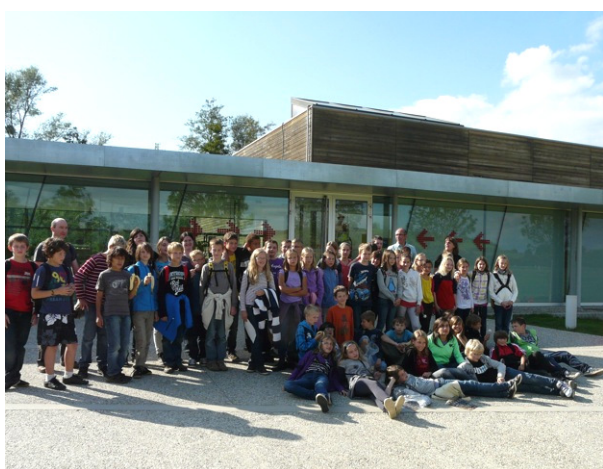
Kl. 6b in Bärenthal

Wir wünschen allen Neuen im Kollegium nochmals einen guten Start und ein erfolgreiches erstes Schuljahr in Neureut!