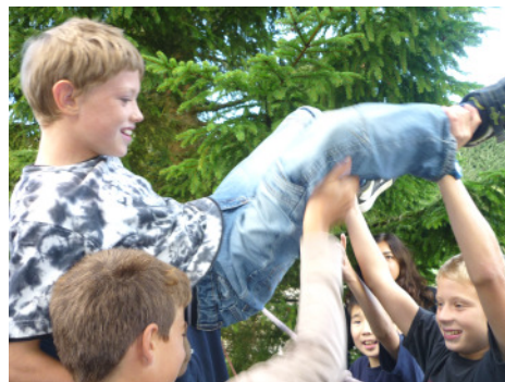
Oben ist es einfach am schönsten... (6b)