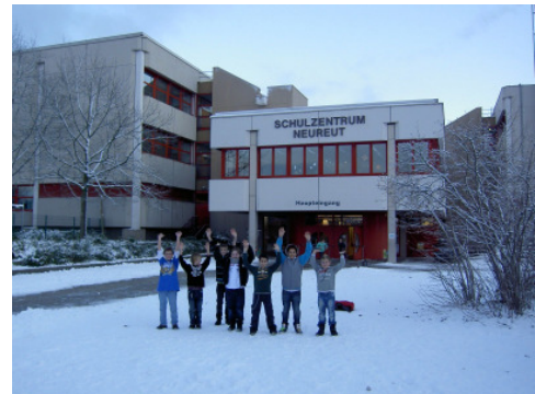
Lieber so ?