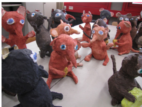
Heimliche Mäuseversammlung bei der 5d (Foto der Überwachungskamera)

Ein Ergebnis liegt schon vor: der SEIS-Schulbericht zu den 8. Klassen. SEIS heißt: „Selbstevaluation in Schulen“; es ist ein umfangreicher Fragebogen, der von Schülern und Eltern der 8. Klassen sowie allen Lehrkräften der Schule ausgefüllt und von SEIS Deutschland gegen Gebühr per Computer ausgewertet wurde. Fast alle haben mitgemacht - das ist eine enorme Leistung und Ansporn, weiter an der Sicherung und Verbesserung der Schulqualität zu arbeiten.