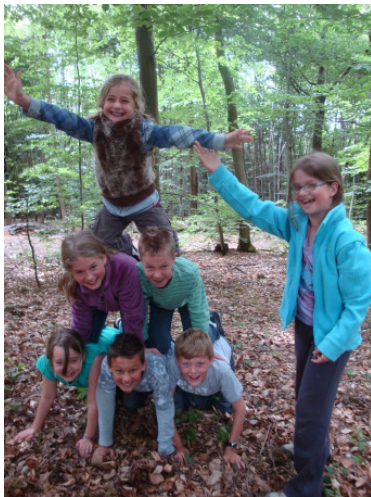
Kl. 5a in Spielberg