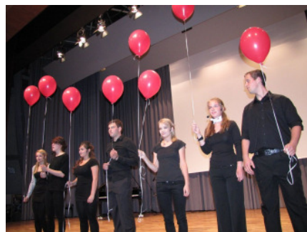
Wer wird denn weinen...? Abiturienten nehmen Abschied