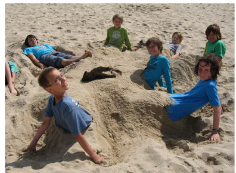
...oder lieber so ?