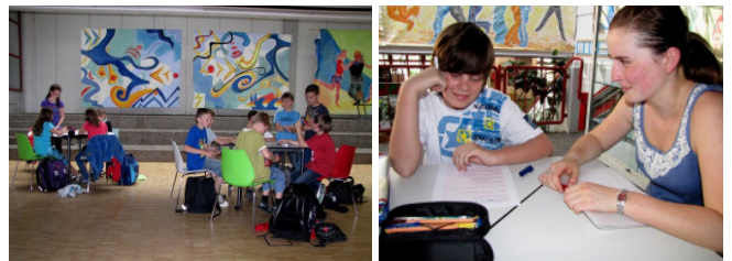
Sitzinseln - hier macht Sitzenbleiben zumindest Spaß

Die Verlockung ist groß: Wer zwei Tage früher fliegt, kann oft erhebliche Summen einsparen. Trotzdem - unsere Eltern bleiben in aller Regel standfest. Und das mit Recht: Eine Befreiung vom Unterricht aus diesen Gründen sieht das Schulgesetz nicht vor. Und „Unterricht“ findet bis zum Schluss statt - vielleicht weniger fachgebunden, dafür mehr in Form von Sporttagen, Wandertagen, Projekten. Dass aber auch diese Aktivitäten wichtig sind, darüber besteht große Einigkeit. – Bleiben Sie also weiter standfest!