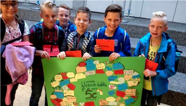
Da sind sie ja: die neuen 5er!

Liebe Schülerinnen und Schüler, liebe Eltern!