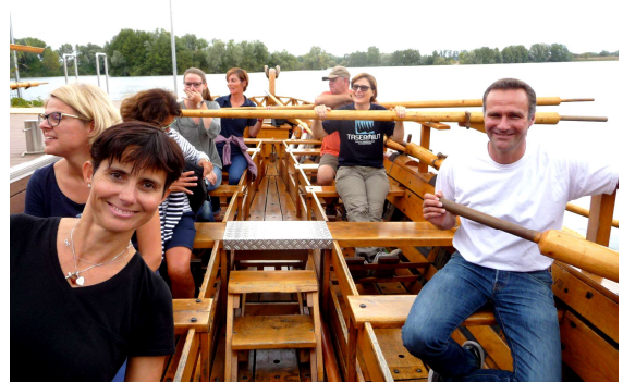
Kollegenausflug Sept. 2018: Wer ist denn hier am Ruder?

alle Schüler/innen- wir drücken die Daumen, dass alles klappt wie gewünscht.