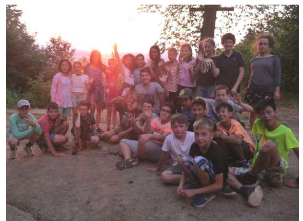
Das war der Sommer 2018: Schullandheim der Kl. 6a