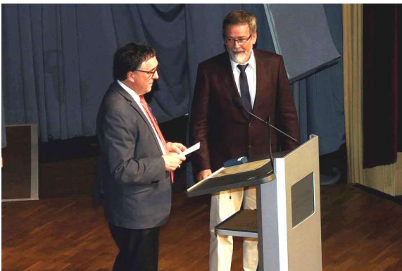
Verleihung der „Palmes académiques“ an JHH

Auch unsere Abiturienten galt es wieder zu verabschieden- wie immer in der Badnerlandhalle, und wie immer gab es zahlreiche Preise und Urkunden, musikalische und Wortbeiträge, die sich diesmal (hat's der Zufall so gewollt? Oder war's Gedankenübertragung? Abgesprochen jedenfalls war es nicht!) allesamt mit dem Thema „Glück“ befassten.